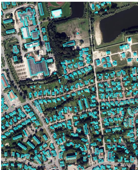
„Die türkisenen Gebäude wurden von einer KI eingezeichnet.“

Im Ergebnis der neuesten KI-Generation zur Gebäudeerkennung, die vom LGLN trainiert wurde, sind die Gebäude mit einer sehr hohen Vollständigkeit und Korrektheit erkannt worden. Ein großer Vorteil der verwendeten KI-Architektur ist die exakte Erkennung der Gebäudegeometrie. Die KI zeichnet die meist eckige Form der Dächer sehr präzise nach.